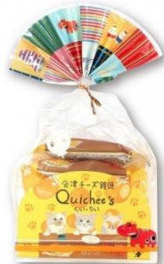
会津チーズ饅頭くいちい 【お菓子の蔵 太郎庵】

「くいちい」とは会津の方言で「食べたい」という意味です。皮にも餡にも濃厚チーズをふんだんに使用した、甘くないお饅頭です。