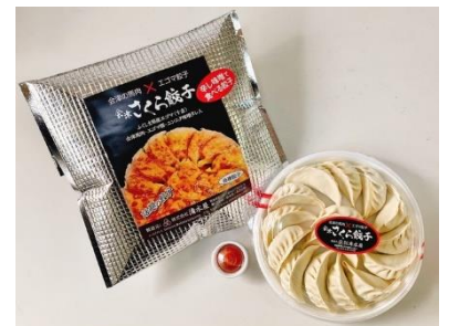
さくら餃子 【株式会社 清水屋】

福島県郡山市産ソーヴィニオン・ブラン100%。柑橘類の爽やかさや、青ゆずや若草の香りも感じるやや辛口の白ワインです。