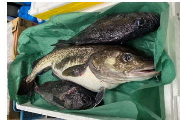
セット外魚種指定