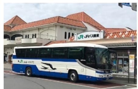
高速バス館山駅到着