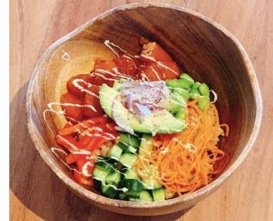
鮭のポキ丼 価格：1,298 円 (税込)