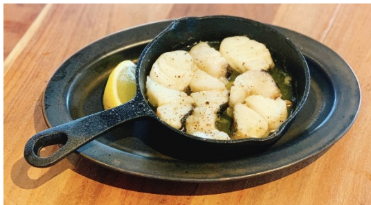
鱈のピルピル (タラのオリーブオイル煮) 価格：748 円 (税込)