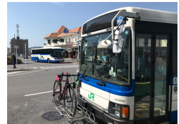
“のってたのしい列車” サイクルトレイン B. B. BASE & B. B. BASE バス