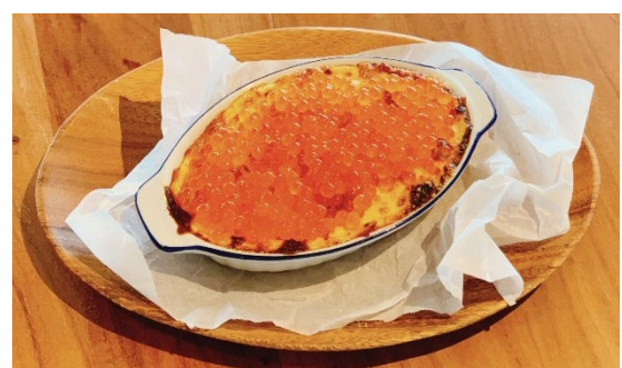
鮭といくらのだリア 価格：2,398 円 (税込) ※限定 20 食