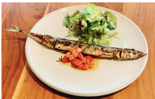
秋刀魚のコンフィ 価格：1,628 円 (税込)