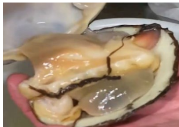
生きたまま届くホッキ貝