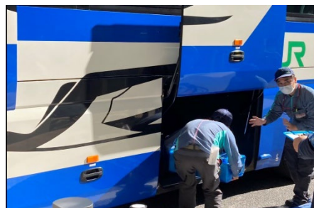
東京駅にて鮮魚載せ替え