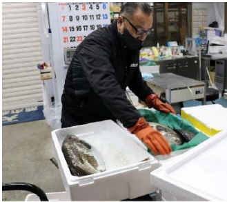
函館の今朝どれ鮮魚を梱包