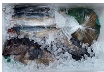
おまかせ函館鮮魚セット