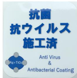
「抗菌・抗ウイルス施工済」ステッカー (鉄道車両内に掲示)