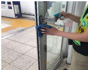
待合室の消毒作業

※職員の熱中症予防のため、お客様と近接しない事を確認したうえでマスクを着用しない場合がございます。