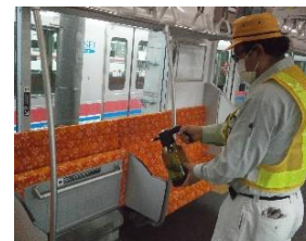
手すりの消毒作業 (一般車両)

お客様におかれましても、手洗い・うがい・咳エチケットのほか、時差出勤など混雑時間帯を避けたご乗車や、車内換気のため天候や混雑状況に応じた窓上部の開閉等へのご協力、また、可能な限り、マスクの着用と会話の際の周囲へのご配慮をお願い申し上げます。