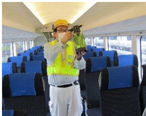
車内荷物置き場の消毒作業 (スカイライナー)