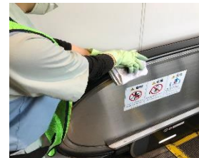
エスカレーターの消毒作業