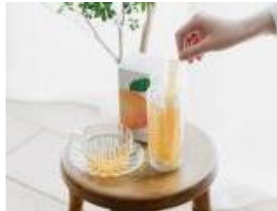
プレミアム フルーツカラーゲンゼリー