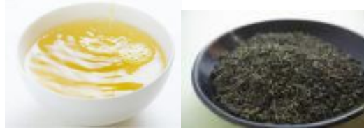
宇部特産の 小野茶