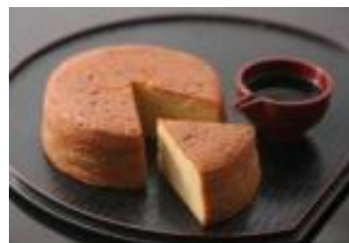
柳井甘露醤油 バターケーキ