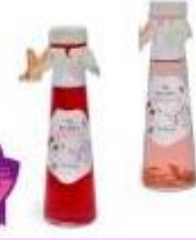
バラジュース セット