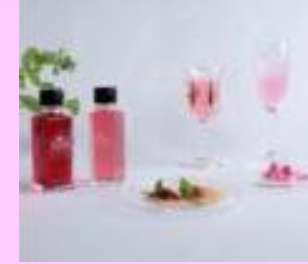
オーガニック ローズ商品