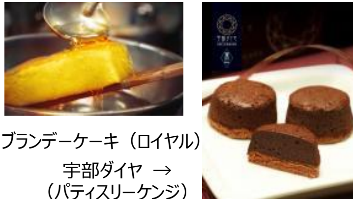
ブランデーケーキ（ロイヤル） 宇部ダイヤ → （パティスリーケンジ）

宇部市近代化の原動力であり黒いダイヤとされた石炭モチーフのチョコレート菓子や、半世紀の伝統をもつ芳醇なブランデーケーキをご用意。西日本最大級の茶園を有する宇部市が誇る、甘みとコクの深さが特徴の小野茶・山口茶とともに、素敵なティータイムをお楽しみください。