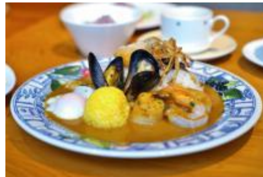
海鮮カレー (偶数日)