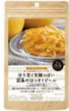
因島の はっさくピール