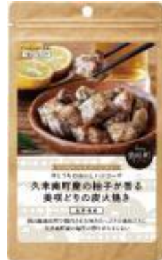
美咲どりの 炭火焼き