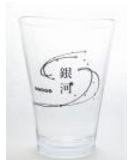
トライタンタンブラー