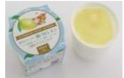
瀬戸田 レモンアイス