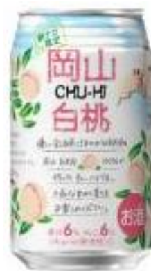
岡山白桃 チューハイ