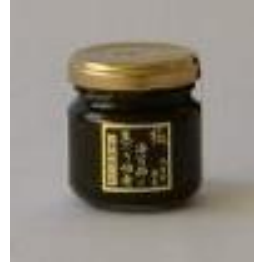
海苔師の生のり 佃煮<極>