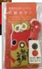
大内塗とお守りセット