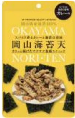
岡山海苔天 カレー