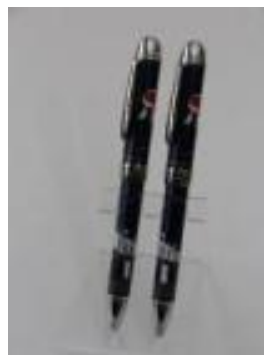
やない優美 時絵ペン