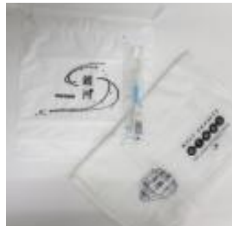
アメニティセット