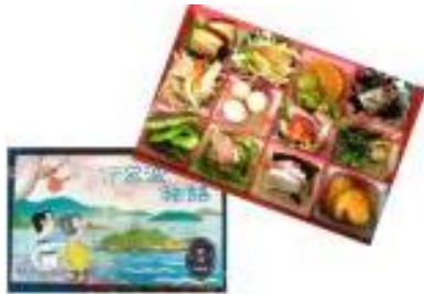
伊呂波物語 銀河おつまみVer.