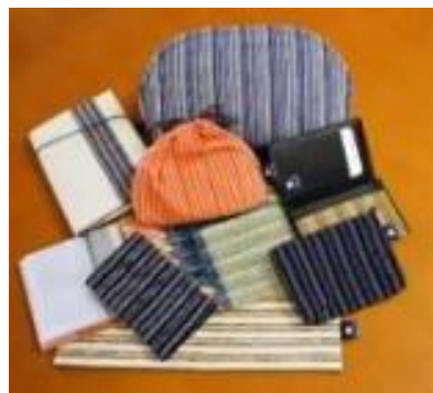
柳井縞を使用した 工芸品