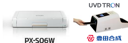
UV-C 高速表面除菌装置