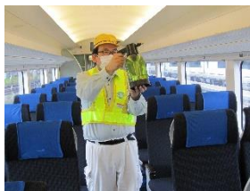
車内荷物置き場の消毒作業 (スカイライナー)