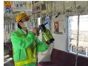
つり革への消毒作業