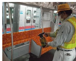
手すりの消毒作業 (一般車両)