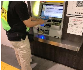
自動券売機の消毒作業

※職員の熱中症予防のため、お客様と近接しない事を確認したうえでマスクを着用しない場合がございます。