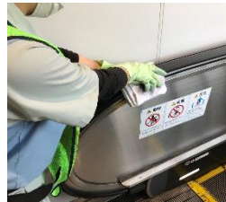
エスカレーターの消毒作業