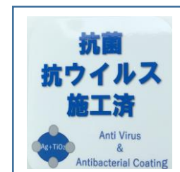
「抗菌・抗ウイルス施工済」ステッカー (鉄道車両内に掲示)

お客様におかれましても、手洗い・うがい・咳エチケットのほか、時差出勤など混雑時間帯を避けたご乗車や、車内換気のため天候や混雑状況に応じた窓上部の開閉等へのご協力、また、可能な限り、マスクの着用と会話の際の周囲へのご配慮をお願い申し上げます。