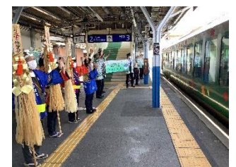
停車駅でのおもてなし(イメージ)

「木遣り」とは 諏訪地方では七年に一度、御柱祭が開催されます。この御柱祭で木を曳く際に唄われるのが木遣りです。曳行の安全を願い、曳き手の気持ちを合わせるために唄われます。次回の式年造営御柱大祭は2022年4月～5月にかけて行われます。