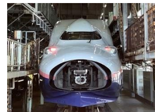
E4系連結器カバー開閉