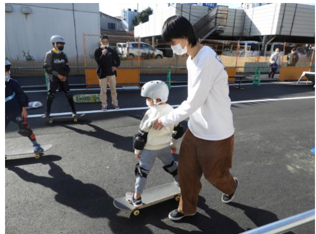
スケートボード体験会（イメージ）