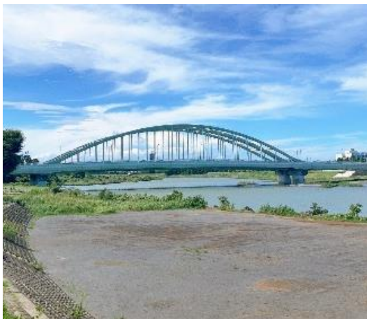
多摩川河川敷（登戸地区広場）

川崎市と小田急電鉄は本年3月「小田急沿線川崎エリアまちづくりビジョン」を公表しており、今後も引き続き、魅力あるにぎわい空間の創出等に向け連携して取組を進めて参ります。