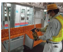
手すりの消毒作業 (一般車両)