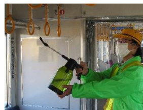
つり革への消毒作業