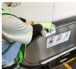
エスカレーターの消毒作業