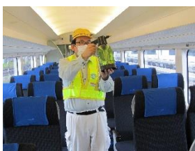
車内荷物置き場の消毒作業 (スカイライナー)