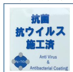
「抗菌・抗ウイルス施工済」ステッカー (鉄道車両内に掲示)

お客様におかれましても、手洗い・うがい・咳エチケットのほか、時差出勤など混雑時間帯を避けたご乗車や、車内換気のため天候や混雑状況に応じた窓上部の開閉等へのご協力、また、可能な限り、マスクの着用と会話の際の周囲へのご配慮をお願い申し上げます。