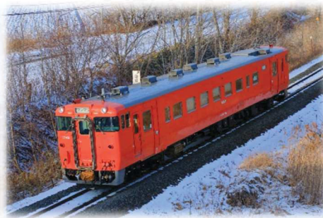
キハ40系朱色一色塗装