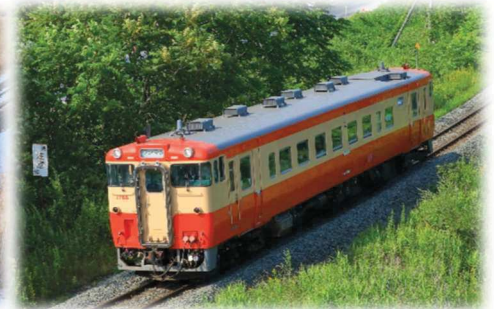
キハ40系国鉄標準色塗装