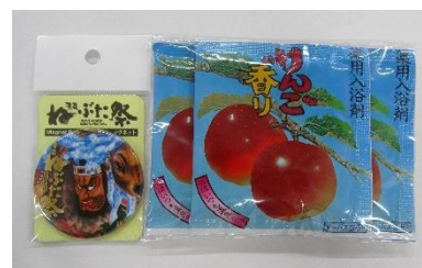
【プレゼントイメージ】