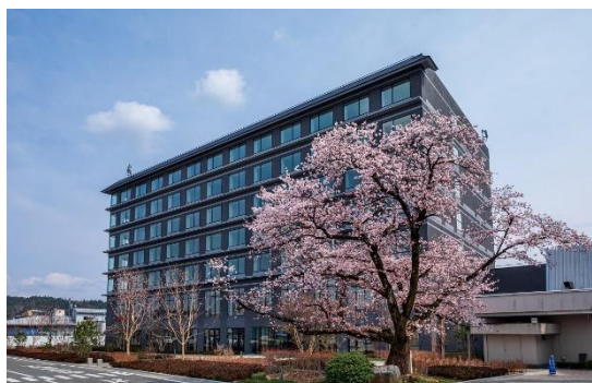
≪高山グリーンホテル 新館「桜凧閣」≫