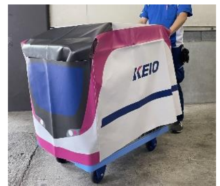
《鉄道での輸送台車イメージ》