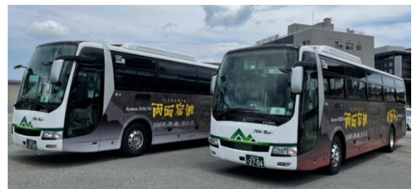
◀「両面宿禰」ラッピングの高速バス車両▶

武勇にすぐれ、神祭の司祭者であり、 農耕の指導者でもあったと言われ、飛騨地域を 中央集権から守ったと語り継がれている英雄。