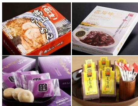
≪飛騨物産館オリジナル商品≫