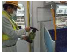
手すりの消毒作業 (一般車両)