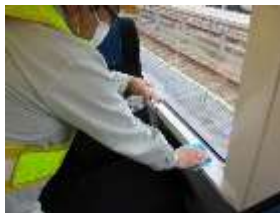
車内窓枠の消毒作業 (スカイライナー)