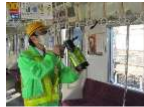
つり革への消毒作業