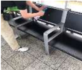
待合室の消毒作業

※職員の熱中症予防のため、お客様と近接しない事を確認したうえでマスクを着用しない場合がございます。