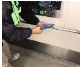
エレベータ内の消毒作業