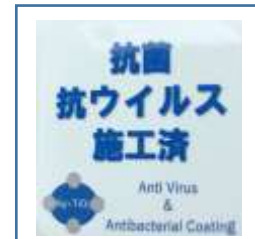
「抗菌・抗ウイルス施工済」ステッカー (鉄道車両内に掲示)

お客様におかれましても、手洗い・うがい・咳エチケットのほか、時差出勤など混雑時間帯を避けたご乗車や、車内換気のため天候や混雑状況に応じた窓上部の開閉等へのご協力、また、可能な限り、マスクの着用と会話の際の周囲へのご配慮をお願い申し上げます。