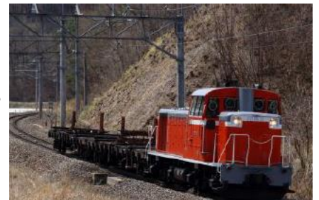
【DD16形ディーゼル機関車(イメージ)】