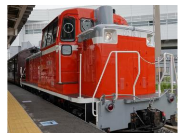
【DD16形ディーゼル機関車(イメージ)】