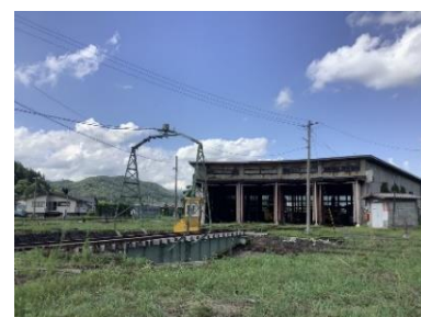
荒屋新町駅転車台

今回の旅行商品では、特別に保守用車を転車台に乗せて稼働するところを見学できます。