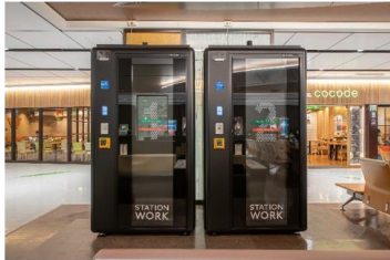
▲ STATION BOOTH仙台(新幹線改札内)