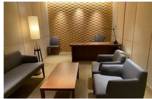
▲STATION DESK 東京 premium 応接室