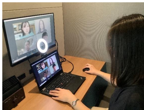
▲内部 LED リングライト