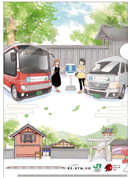
「角館エリア&角館武家屋敷」 クリアファイルイメージ (そふとめんデザイン)