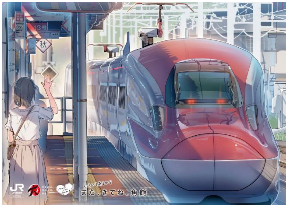
「E6系新幹線と角館駅」 クリアファイルイメージ (daito デザイン)