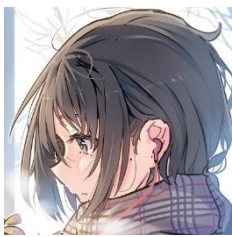
イラストレーター「daito」