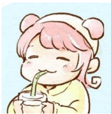
イラストレーター「そふとめん」

リトルアーモリーシリーズ(©トミーテック)のパッケージデザインや「ひたちなか海浜鉄道」鉄道むすめキャラクターデザインを担当。