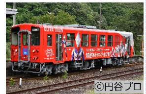
海洋堂ホビートレイン「ウルトラトレイン号」

車体には、ウルトラマンやウルトラマンティガなどのフィギュアが描かれており、大人から子供まで見る人を楽しませる列車です。