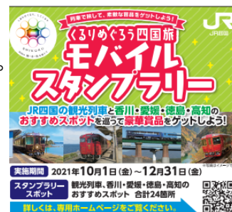
公式サイトイメージ