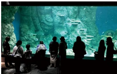
高知県立足摺海洋館・SATOUMI ガイドツアー (高知県)

飼育員が館内の見どころや担当生物の解説を行います。普段は聞けないような話も満載。水族館が何倍も楽しくなるツアーです。