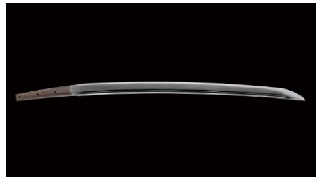
名刀見参 京極家の宝刀ニッカリ青江公開 (香川県)

丸亀藩京極家の家宝で国の重要美術品「ニッカリ青江脇指」を特別展示。「刀剣乱舞-ONLINE」とのコラボ企画も実施予定です。