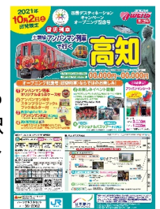
パンフレットイメージ

URL： https://digitalpamph.nta.co.jp/library/f-pub/search.php?meta1=kansai&meta2=shikoku