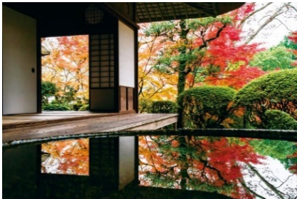
おおず歴史華回廊 (愛媛県)

地元を知り尽くした案内人と一緒に、普段は立ち入れない江戸の面影を残す風景をめぐる、四国 DC の特別な旅です。