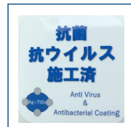
「抗菌・抗ウイルス施工済」ステッカー (鉄道車両内に掲示)

お客様におかれましても、手洗い・うがい・咳エチケットのほか、時差出勤など混雑時間帯を避けたご乗車や、車内換気のため天候や混雑状況に応じた窓上部の開閉等へのご協力、また、可能な限り、マスクの着用と会話の際の周囲へのご配慮をお願い申し上げます。