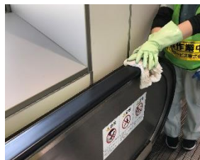
エスカレータ手すりの消毒作業