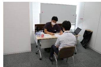
ワクチン職域接種の様子