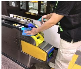
自動改札機の消毒作業

※職員の熱中症予防のため、お客様と近接しない事を確認したうえでマスクを着用しない場合がございます。