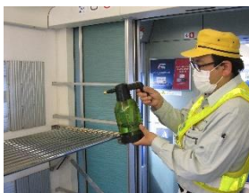
荷物置き場の消毒作業 (スカイライナー)