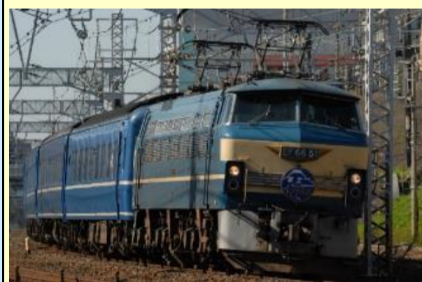
EF66形特急牽引機・グレー台車 同時期発売予定