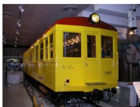
【旧 1000 形車両】 （地下鉄博物館に展示）

さらに、安全性・快適性を追求し当時の最新技術を導入した旧 1000 形の DNA を受け継ぎ、省エネルギーを追求した永久磁石同期モータや、騒音・振動を低減し快適な乗り心地を実現する操舵台車など、最新技術を採り入れています。