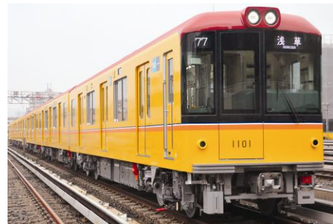
【銀座線新型車両 1000 系】