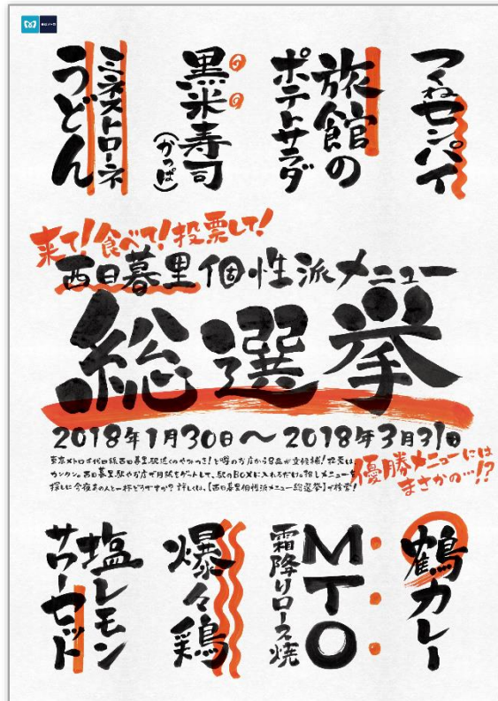
告知ポスター イメージ