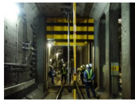
▲大規模浸水対策(防水ゲート)

日比谷線虎ノ門ヒルズ駅や銀座線虎ノ門駅など、駅・まち一体の調和のとれたゆとりある空間を整備します。