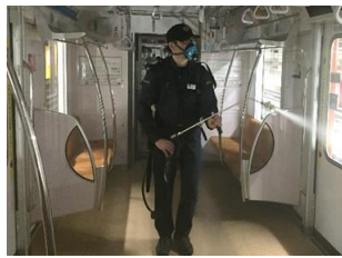
▲車両内における抗菌処置イメージ

車両内や駅構内における消毒・抗菌を実施し、安心してご利用いただける環境を整備します。