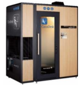
▲個室型ワークスペース CocoDesk