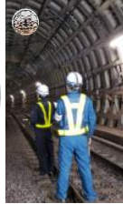
▲自立飛行型ドローンによるトンネル検査