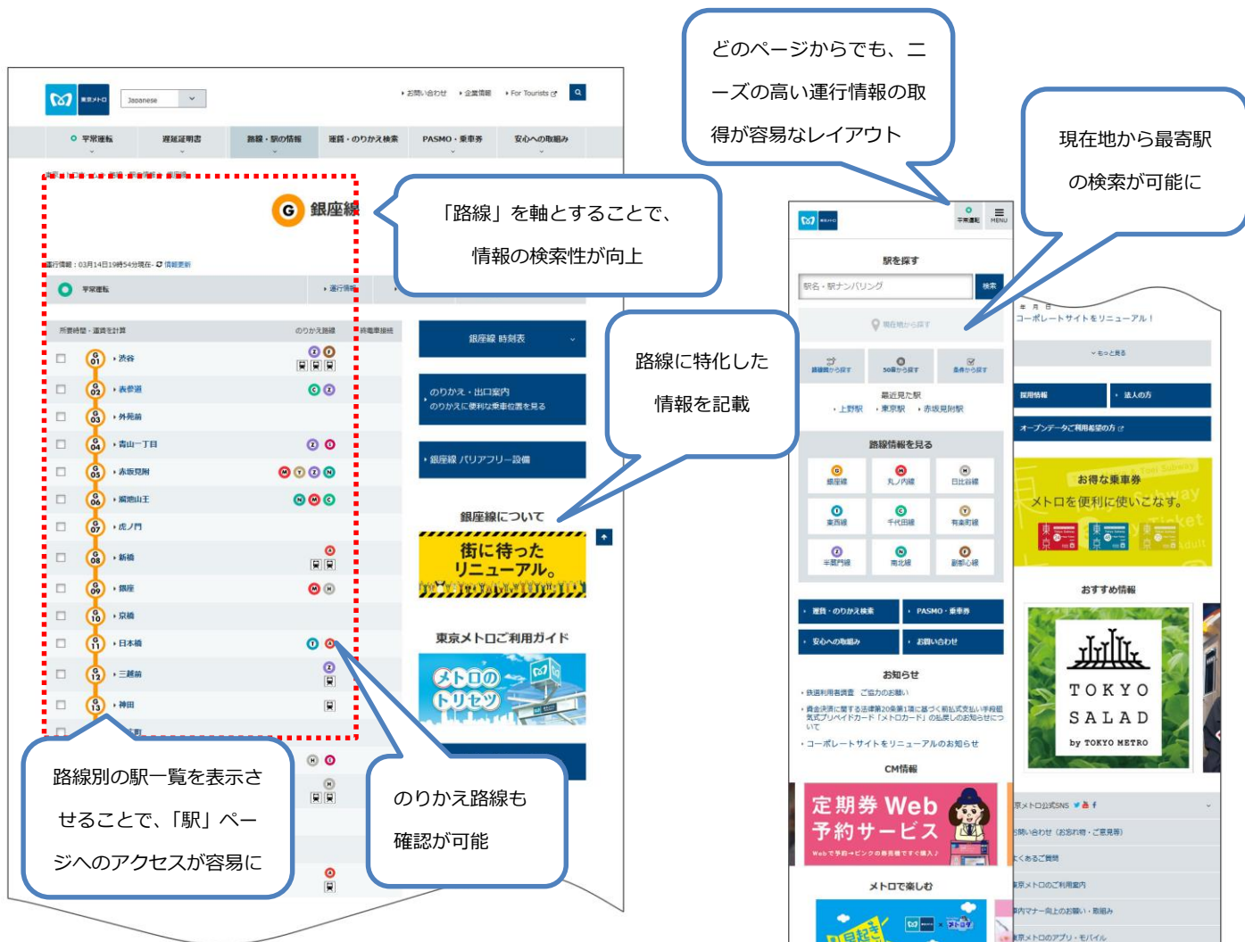
1. 路線ページイメージ