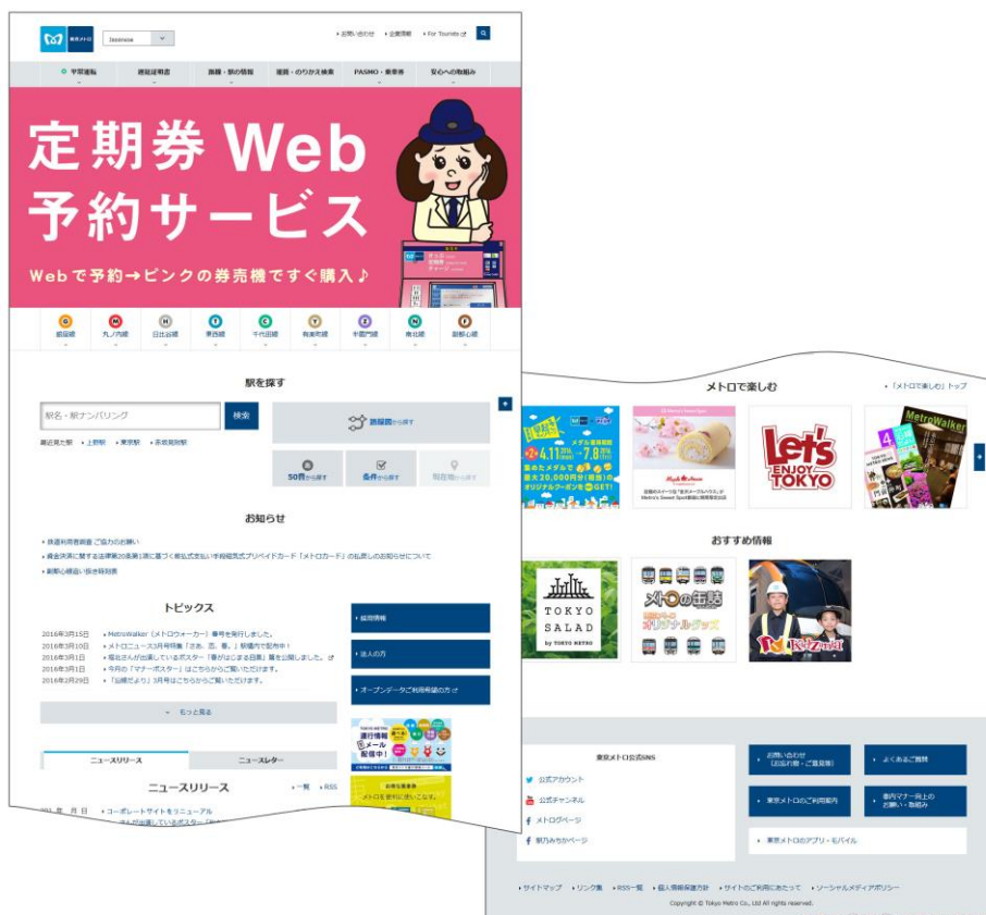
コーポレートサイト HOME (PC) イメージ