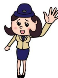
東京メトロ サービスマネージャー 駅乃みちか