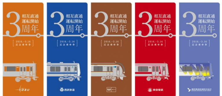
記念乗車券（台紙）イメージ