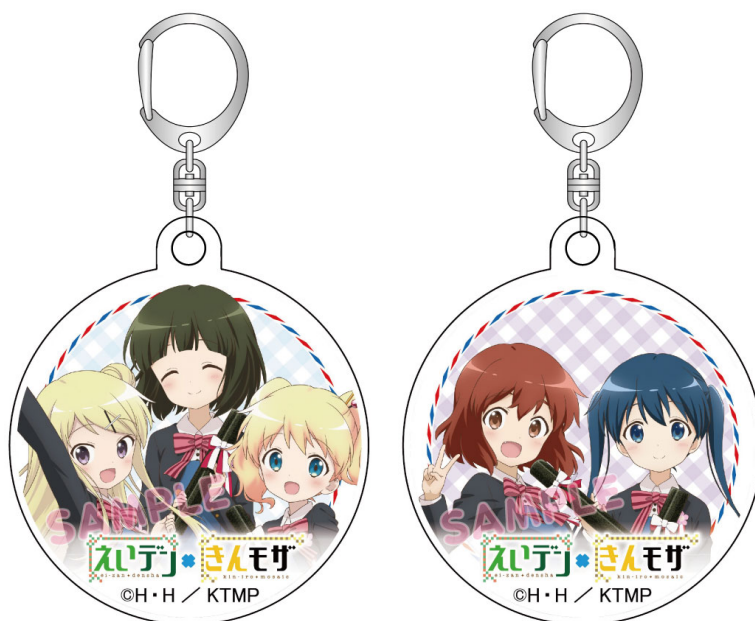
アクリルヘッドマークキーホルダーのイメージ