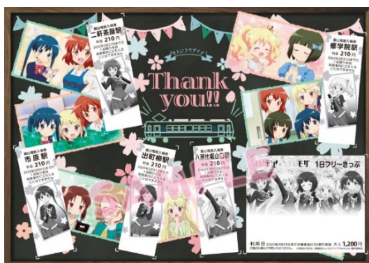
コラボきっぷのイメージ