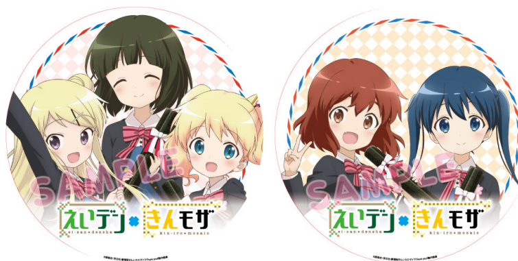
ヘッドマークのイメージ