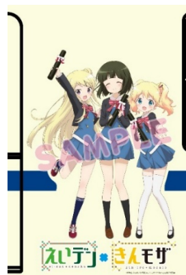
コラボラッピングのイメージ