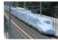
九州新幹線「さくら」 (イメージ)