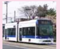
函館市電(らっくる号)