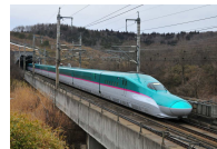
東北新幹線「はやぶさ」 (イメージ)