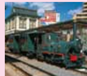
伊予鉄道(坊っちゃん列車)