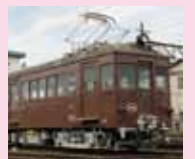
ことでん(レトロ電車)