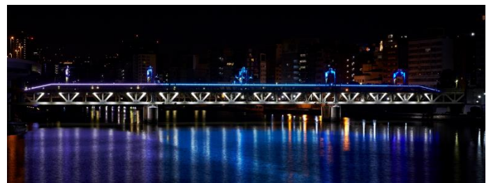
△ 隅田川橋梁特別色「90th感謝」ライトアップ（イメージ）