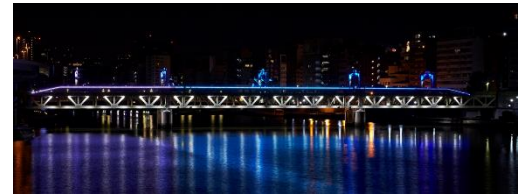
△ 隅田川橋梁特別色「90th感謝」ライトアップ （イメージ）

「90th感謝」と名付けた青を基調としたライトアップです。青は隅田川をイメージしており、東武線が隅田川を渡り、都心に乗り入れることが念願であったことに由来しています。