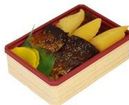
【練みがき弁当イメージ】