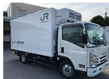
【東京駅からトラック等で納品先まで輸送】