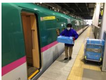
【新函館北斗駅ホームでの積み込み】