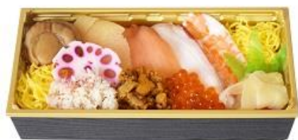
【蝦夷ちらしイメージ】

北海道キヨスク(株)の「駅弁の函館みかど」弁当工場にて製造した「蝦夷ちらし」と「練みがき弁当」を輸送し、東京駅構内の「駅弁屋 祭グランスタ店」にて販売します。