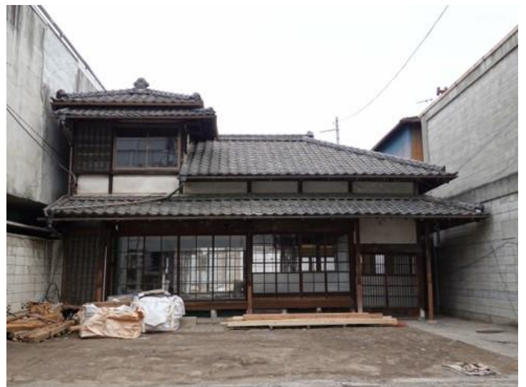
現地写真（2021年3月19日時点）