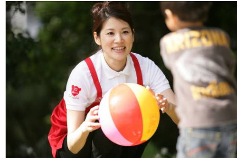
【暮らしサポートサービスの展開】