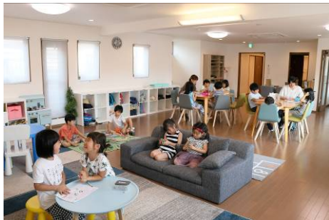
【多様な子育て施設の展開】

子育て世代の価値観の変化やポストコロナにおけるニューノーマル時代の到来を踏まえ、「保育園中心の子育て支援施設」から「多様な子育て支援施設」の開設推進へとステップアップを進め、時代に即したサービス展開をしております。また、施設開発だけでなく、家事や育児のお困りごとをサポートする「暮らしサポートサービスの展開」など、新たなサービス提供の検討も進めてまいります。