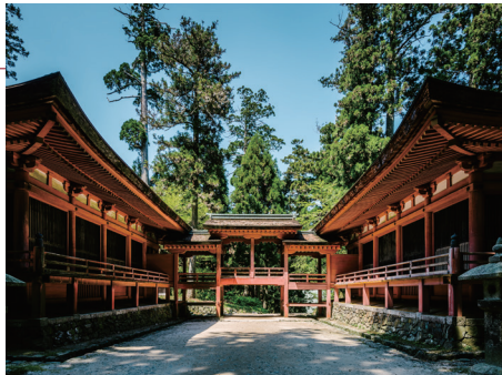
比叡山延曆寺(擔堂)