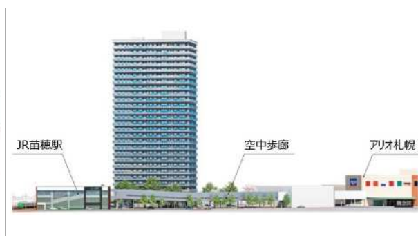
「空中歩廊」（イメージ図）

札幌の都市再生を進める本事業の一環として、「苗穂」駅北口から商業施設「アリオ札幌」1階敷地までの約200mを屋根や壁で覆われた全天候型の空中歩廊で結びます。「苗穂」駅の南北を結ぶ自由通路にも直結し、雨や雪の影響を受けることなく、快適にご移動いただけます。今後、アリオ札幌2階部分へ空中歩廊の開通を予定していますが、その時期については現在未定です。