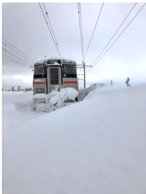
・当該列車(先頭部)側雪の状況