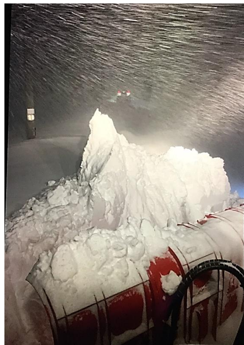
・救済に向かった排雪モーターカーより撮影した雪の状況