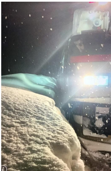
・当該列車(最後部)側雪の状況