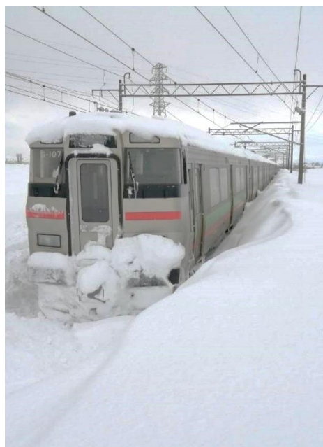
・当該列車(先頭部)の側雪の状況