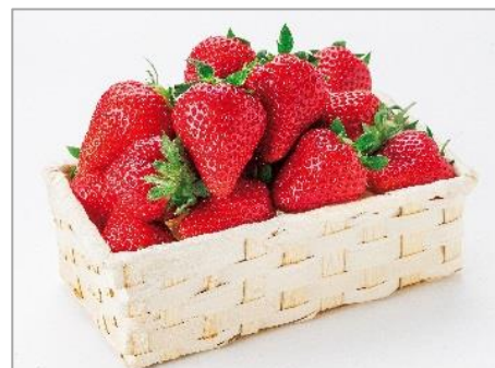
熊本生まれのいちご新品種「ゆうべに」