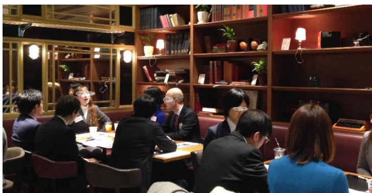
Echika fit 永田町 (前回開催時の様子)

軽い食事やコーヒーなどを飲みながらリラックスした雰囲気、ちょっとまじめなビジネス英会話レッスン。外国人講師を交え、初心者向けの分かりやすいビジネス英会話を自由な雰囲気です。レッスン中は飲み物(各種ソフトドリンク等)と軽食をお楽しみいただけます。