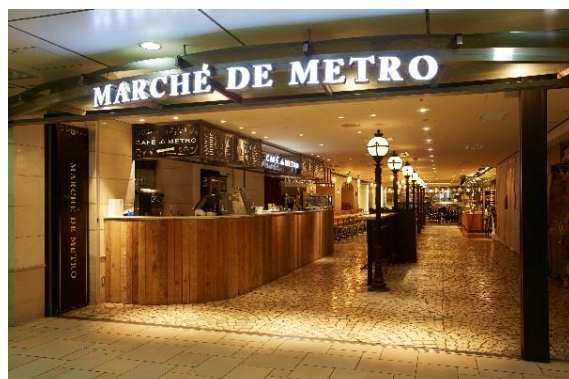
Echika 表参道 マルシェ・ドウ・メトロ