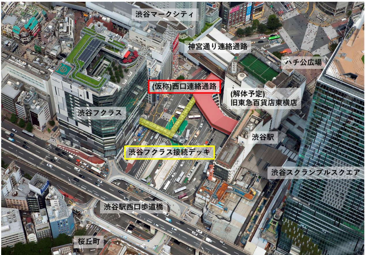
歩行者デッキ全体図