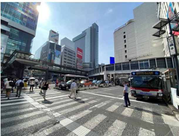
歩行者デッキ全景（渋谷駅方面から見る）