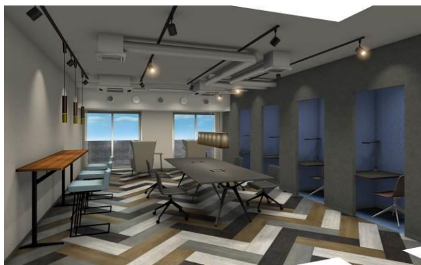
△ソライエアイル草加 ワークスペース（イメージ）