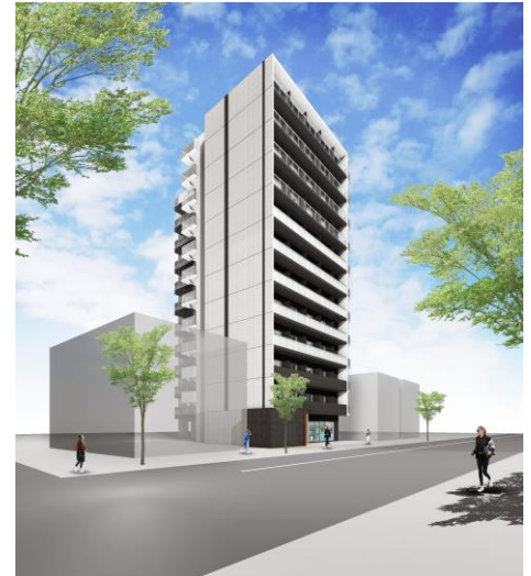
△ソライエアイル草加 外観 (イメージ)