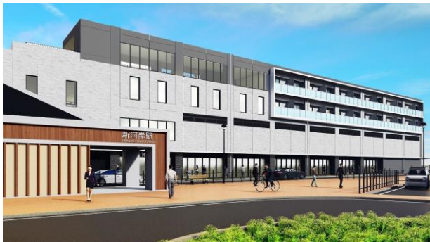
△ソライエアイル新河岸 外観（イメージ）