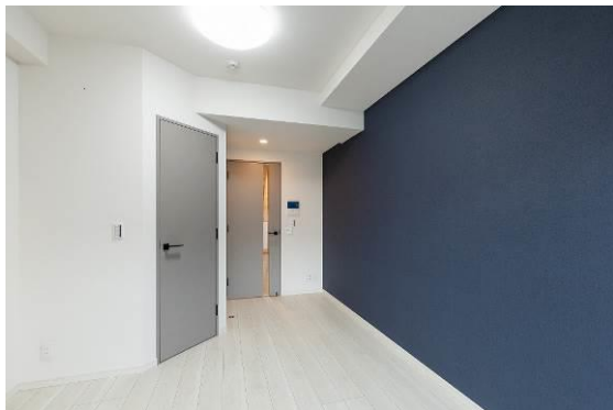
△ソライエアイル草加 内観 (イメージ)