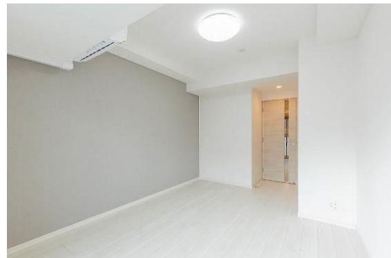
△ソライエアイル草加 内観 (イメージ)