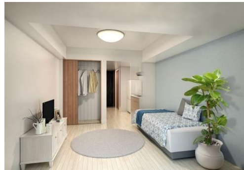
△ソライエアイル新河岸 内観（イメージ）