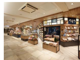
【のもの東京駅グランスタ丸の内店】