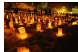
キャンドルライブ