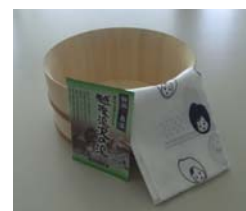
越後湯沢温泉セット