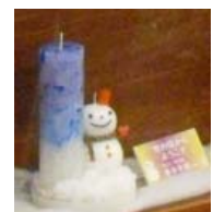
キャンドルイメージ