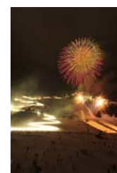
湯沢温泉雪まつり