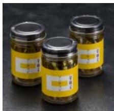
自家製 アンチョビ

温泉の熱を利用して栽培された伊豆メロンを使用したスポンジに、特製カスタードとメロンエキスの生クリームをサンドした香り豊かなロールケーキです。1/19(木)、1/20(金)の限定販売です。