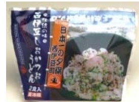
西伊豆しおかつうどん