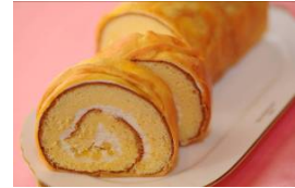
イタリアンロール

果実が大粒で香りが高く、果汁もたっぷりのいちごです。硬めでしっかりしているので、ケーキなどのデコレーションにも適しています。