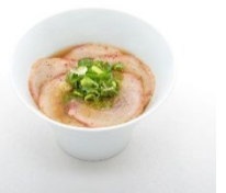
チャーシューヌードル