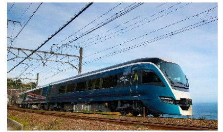
サフィール踊り子