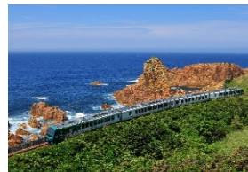
リゾートしらかみ