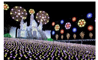
足利イルミネーション(253系) あしかがフラワーパーク