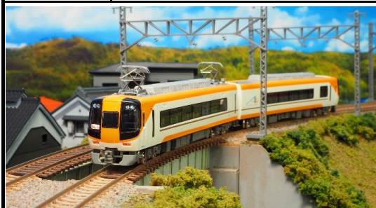
近畿日本鉄道(株)商品化許諾済

近鉄22000系ACEは、新世代の特急車両として1992年に登場した車両で、21000系や26000系の高貴な内装デザインを踏襲しつつ、座席構造の一新、バリアフリー対応設備の導入、乗降扉にプラグドアを採用、ボルスタレス台車やVVVFインバーター制御の導入等、内外装のデザインから車両性能等全てにおいて従来の近鉄特急車両とは一線を画す設計思想の下で製造された車両です。2015年11月からリニューアル工事が実施され、喫煙室の設置と新しい近鉄汎用特急色に変更されています。