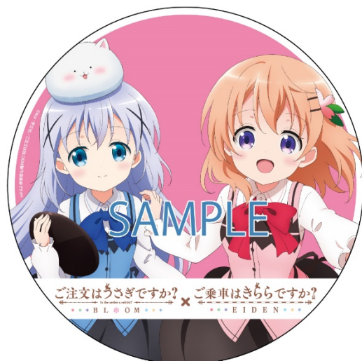
コラボヘッドマークのイメージ