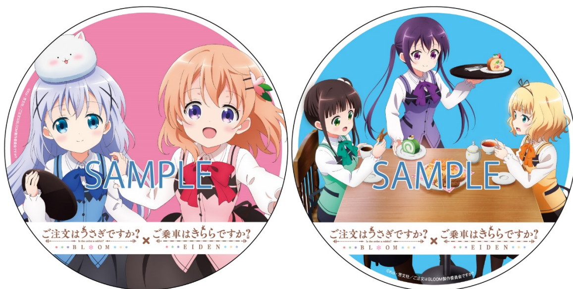
コラボヘッドマーク