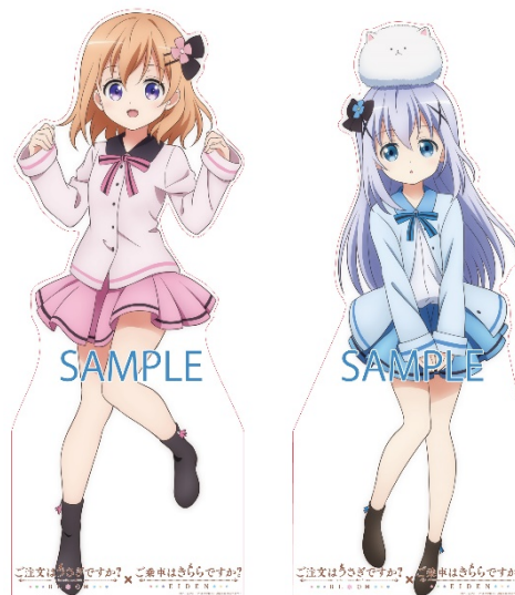
スタンディPOPのイメージ