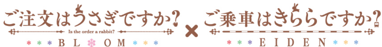
コラボロゴのイメージ

全ての企画には、「ご注文はうさぎですか?×ご乗車はきららですか?」コラボロゴを使用します。