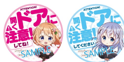
ドア注意喚起ステッカー