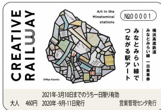
券面イメージ：金子未弥《未発見の小惑星：数光年離れた横浜》

「Creative Railway -みなとみらい線でつながる駅アート」の記念として、また「ヨコハマトリエンナーレ 2020」やみなとみらい線沿線のスポット巡りにぜひご利用ください。