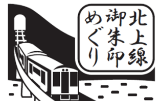
オリジナルスタンプ(イメージ)