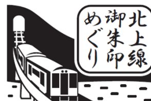
オリジナルスタンプ(イメージ)