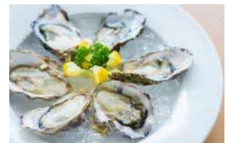
牡蠣料理（イメージ）

広島広域都市圏内に点在する、和食や洋食、お好み焼き、ラーメンなど様々な飲食店が、「瀬戸内かき海鮮食堂」として、名産の牡蠣や瀬戸内海の海鮮を主役とした期間限定メニューをご提供します。