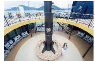
船内の様子（イメージ）