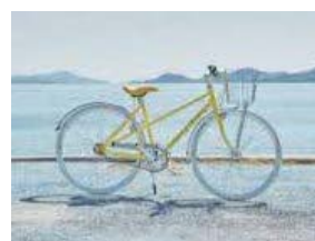
SHIMANAMI LEMON BIKE

「SHIMANAMI LEMON BIKE」と、せとうち広島DCに合わせて登場予定の、坂道も楽々、気軽に楽しめる電動自転車「SHIMANAMI LEMON e-BIKE」の2種類からお選びいただけます。