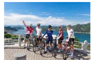
サイクリング（イメージ）

7つの島を7つの橋で結ぶ「とびしま海道」。指定のポートに配車、乗り捨て可能な「とびしま海道レンタサイクル」は人気です。自信のある方は7島制覇もよし、家族で1島1周もよし。