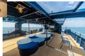
「SEA SPICA」外観（左）、2階屋外デッキ「スピカテラス」（右上下）