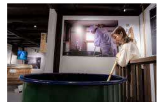
賀茂鶴酒造見学室直売所（イメージ）

西条駅南側に広がる西条酒蔵通りには7軒もの酒蔵が立ち並びます。歩いて酒蔵めぐりを楽しめるほか、お酒の試飲（無料・有料）や各酒蔵オリジナルグッズの購入もできます。