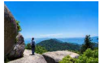
弥山山頂（イメージ）

宮島の最高峰、弥生の山頂に巨岩・奇岩が点在する弥山原始林は、世界遺産「厳島神社」指定区域の一角を担っています。眼下に広がる瀬戸内海の多島美は絶景です。