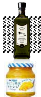
「SETOUCHI BLOSSOM」(左) 原料の「桜尾」・「まるごと果実」(右)

中国醸造（廿日市市）のジャパニーズクラフトジン「桜尾」とアヲハタ（竹原市）のフルーツプレッド「まるごと果実」を使用した、せとうちらしい柑橘薫る爽やかなジントニックです。