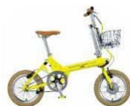
SHIMANAMI LEMON e-BIKE イメージ