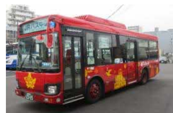
「めいぶる〜ぶ」バス 外観イメージ