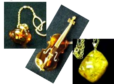
琥珀アクセサリー各種 久慈琥珀（株）

久慈地方で産出する琥珀は中生代白亜紀後期の約 8500 万年前の恐竜時代に属し、宝飾品などに加工されている琥珀としては、世界で最も古い年代のものです。