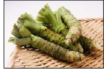
わさび（遠野産） （社）遠野ふるさと公社

遠野市上郷町の暮坪地区だけで栽培されている幻のかぶです。そば、刺身、焼き魚の薬味、漬物にして食べると美味しいです。