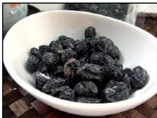
あまくろ （株）道の奥ファーム

遠野産の黒豆を特製の砂糖蜜にじっくり漬け込み乾燥させた甘納豆です。黒豆の甘みが引き立つ、甘さ控えめに仕上げました。