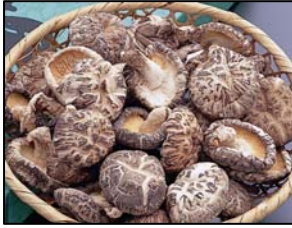
乾燥椎茸（岩手県産） （社）遠野ふるさと公社

原木椎茸を乾燥させ、味、香り、旨みを濃縮しています。煮物や佃煮の具材だけでなく、出汁をとるにも最適です。会場では、量り売りを行います。