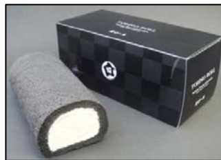
黒ロール （株）道の奥ファーム

遠野産の黒豆を特製の砂糖蜜にじっくり漬け込み乾燥させた甘納豆です。黒豆の甘みが引き立つ、甘さ控えめに仕上げました。