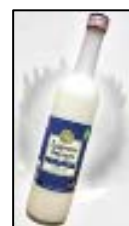
リカースイーツ ミルキーヨーグルト 赤武酒造（株）

杜氏が最高品質を目指して作りました。香り高く、品格のある芳醇辛口のお酒です。2010年、第10回全米日本酒観評会にて金賞を受賞しました。