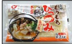
南部もちもちひつつみ （株）小川製麺

小麦粉を練って作ったひつつみは、「もちもち」とした食感です。季節の野菜と一緒に煮込み、岩手南部郷土の味をお楽しみください。