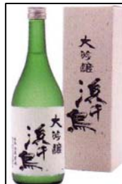
浜千鳥 大吟醸 （株）浜千鳥

10月から4月までの季節限定商品です。この季節にしか味わえない、とろりとした口当たりをお楽しみください。