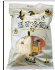
ぴよんぴよん舎 盛岡冷麺 （株）中原商店

小麦粉を練って作ったひつつみは、「もちもち」とした食感です。季節の野菜と一緒に煮込み、岩手南部郷土の味をお楽しみください。