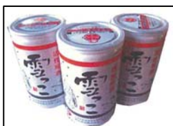
活性原酒 雪っこ 酔仙酒造（株）

10月から4月までの季節限定商品です。この季節にしか味わえない、とろりとした口当たりをお楽しみください。