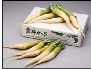
暮坪かぶ（遠野産） （社）遠野ふるさと公社

原木椎茸を乾燥させ、味、香り、旨みを濃縮しています。煮物や佃煮の具材だけでなく、出汁をとるにも最適です。会場では、量り売りを行います。